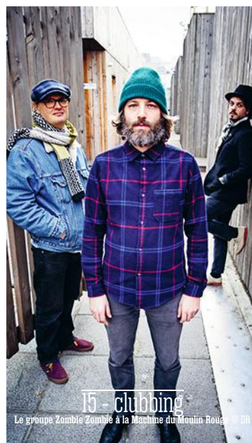
15 - clubbing Le groupe Zombie Zombié à la Machine du Moulin Rouge