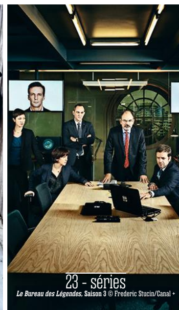
23 - séries Le Bureau des Légendes, Saison 3